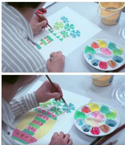
提示：在調顏料時可加上白色，可令效果更加突出。