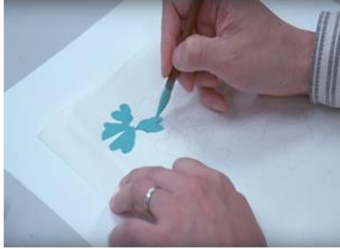
3 上色：用筆尖細筆點畫。