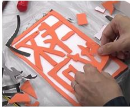
11. 貼好的彩麗皮文字會是「反面」的。