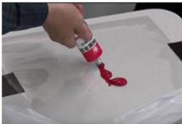
1. 擠出水溶性版畫油墨；