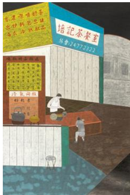
培記茶餐廳／2009 紙本水墨設色