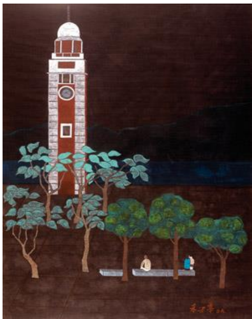
鐘樓·母與子／2009 紙本水墨設色