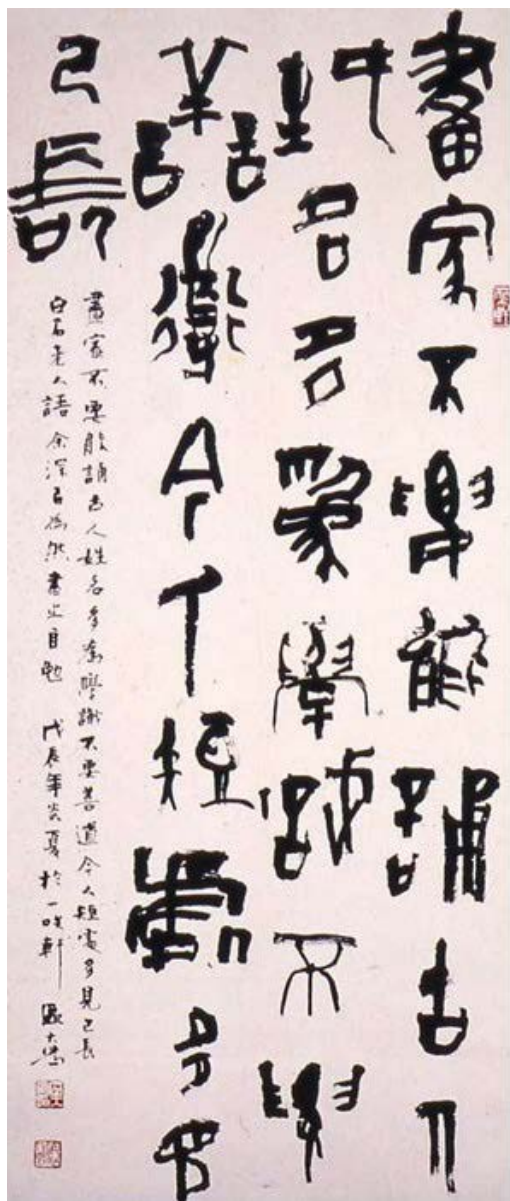
書法錄白石老人句 / 1988 水墨紙本 香港藝術館藏品