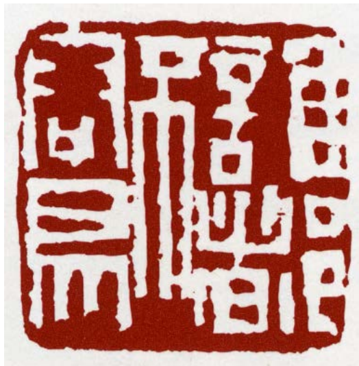
白文方印章 / 2006