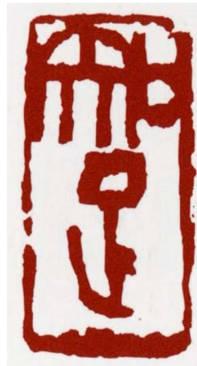
朱文方印章 / 2003