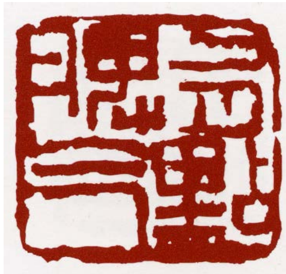
朱文方印章 / 2008