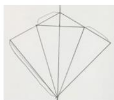
2. 在平面圖加上用作黏合的面。