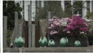
逝的聯想 / 1978 太古