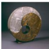
陰陽 / 1970 黃銅及錫