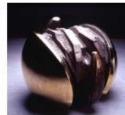
新生之二 / 1991 青銅