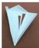
4. 可用利刀雕空某部分的平面圖，設計出圖案。