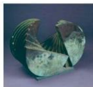
綠色指形 / 1978 黃銅