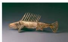
魚之二 (模型) / 1983 黃銅