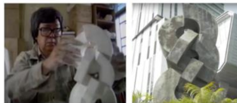
4. 按模型放大，鑄造成需要的尺寸大小。