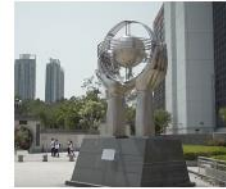
保護地球 / 1993 沙田公園