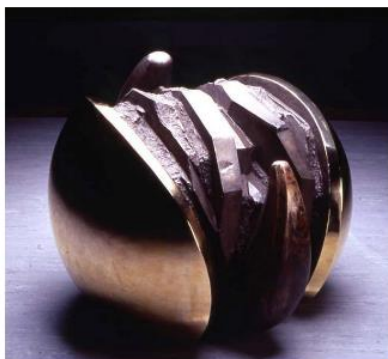
新生之二 / 1991 青銅 香港藝術館藏品