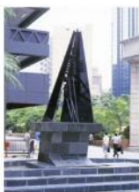
靜止的風扇 / 1984 不銹鋼及青銅