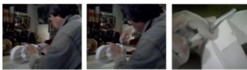
3. 細緻雕刻打磨後成模型。