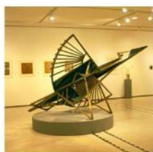
風扇 / 1985 黃銅、不銹鋼及錫