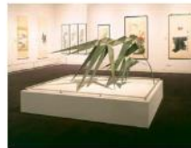
秋葉 / 1984-1985 青銅