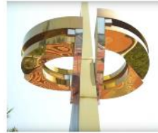
香港回歸十周年紀念雕塑 / 2007 大埔海濱公園