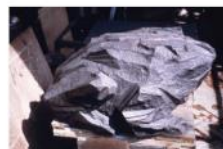
魚 / 1989 青銅