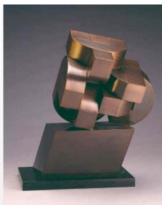
雕塑結構(二) / 1981 青銅 香港藝術館藏品