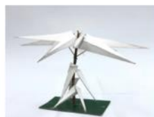
6. 用熱溶膠槍將所有材料黏好。