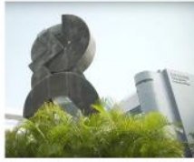
發展 / 1991 香港城市大學