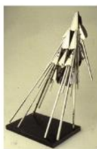
太空相 / 1980 不銹鋼