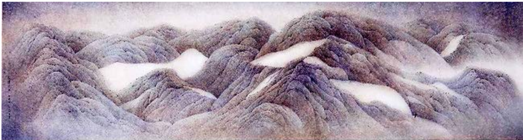
思遠 / 1975 水墨設色紙本 香港藝術館藏品