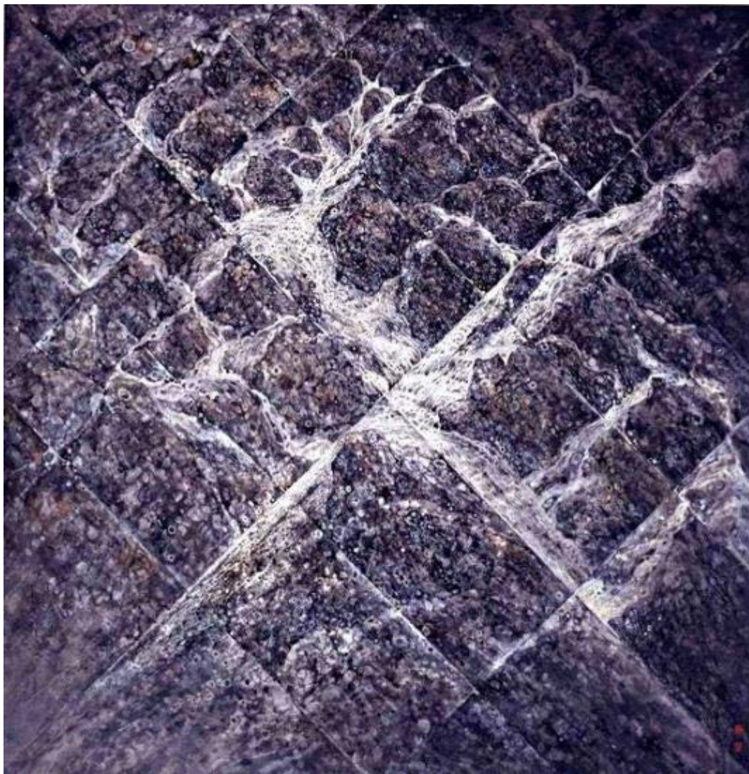
激流之九 / 1989 水墨設色紙本 香港藝術館藏品