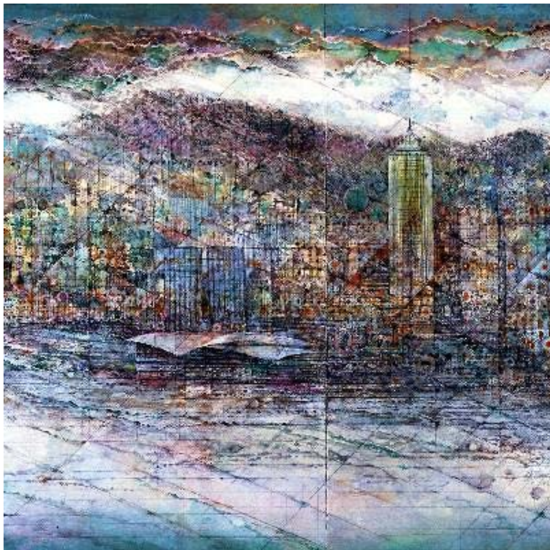
香江幻彩 / 1999 水墨設色紙本 香港藝術館藏品