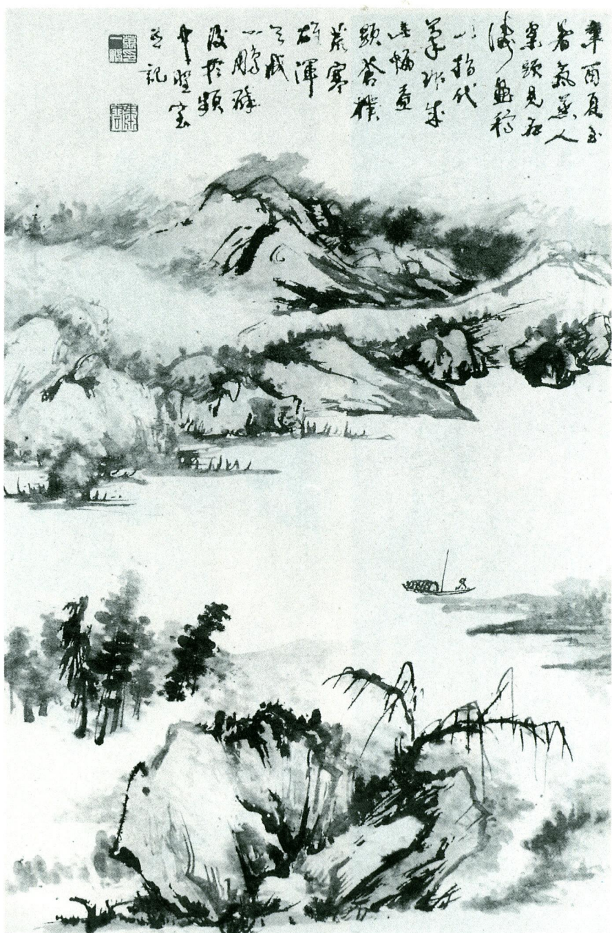
萬一鵬 煙江夜泊指畫圖軸 一九八一