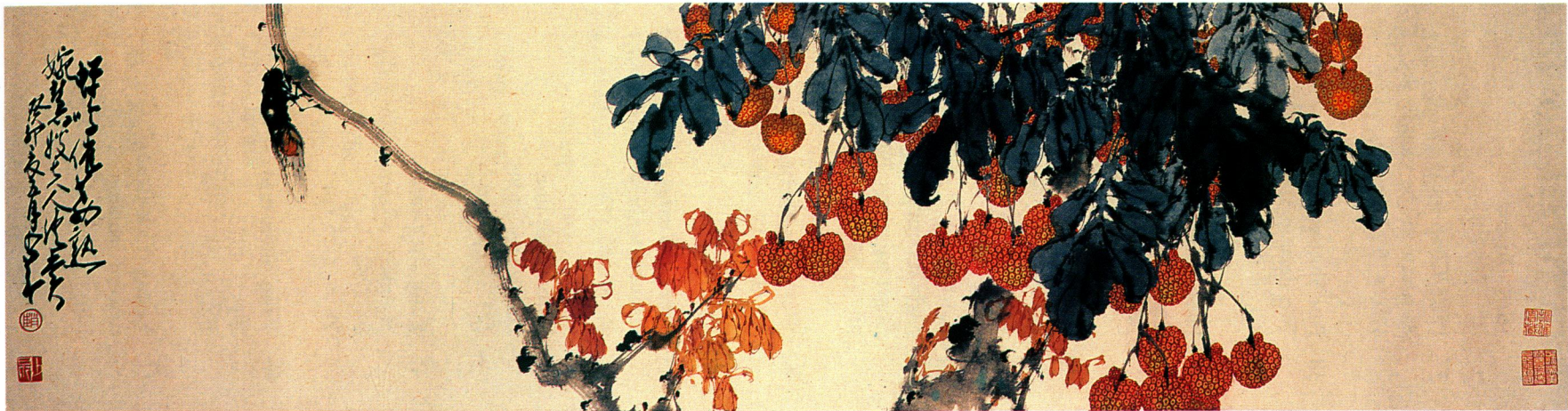
趙少昂 蟬鳴催荔熟 一九六三 Chao Shao-an Cicade on a lychee tree 1963