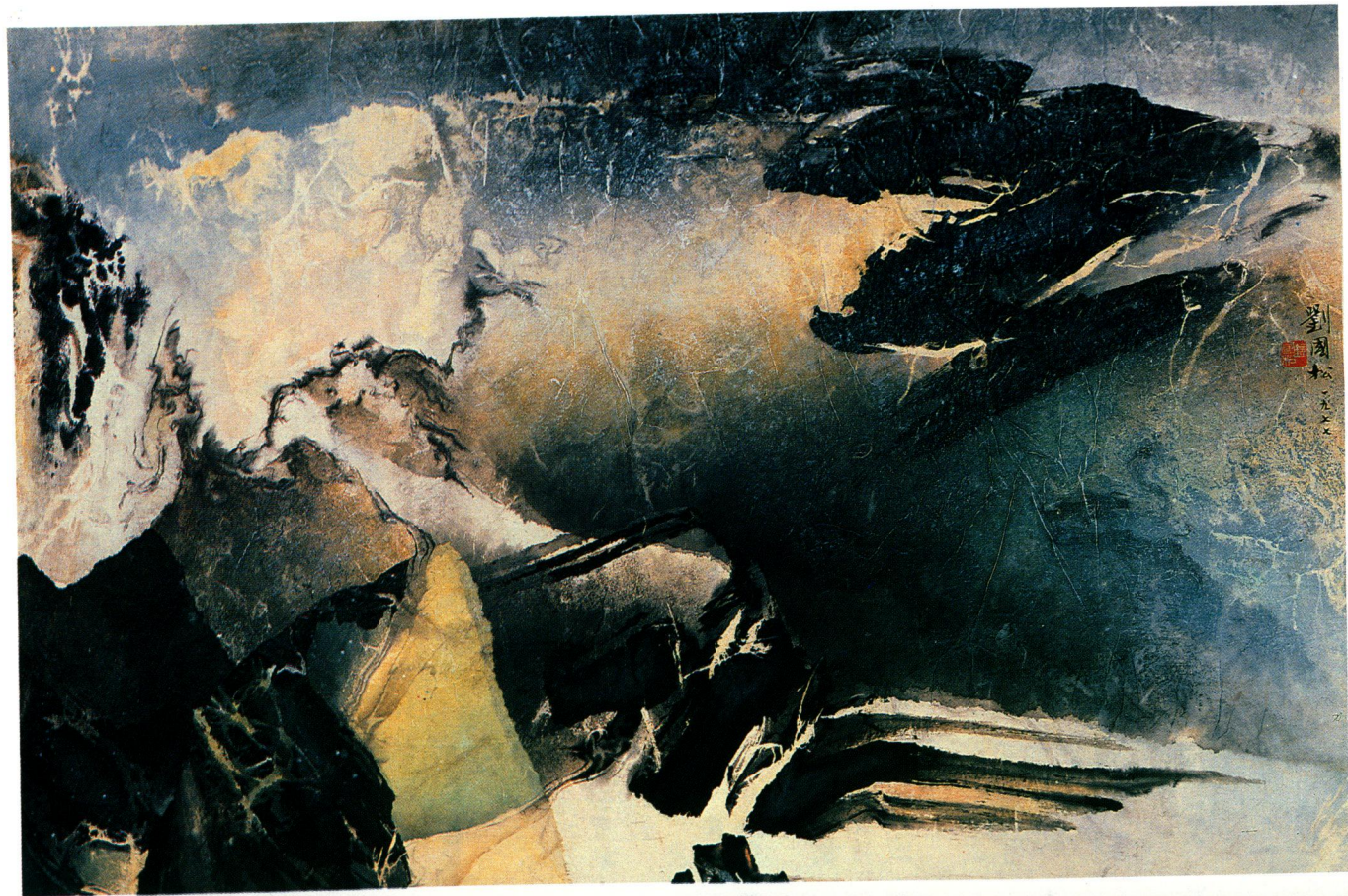
劉國松 灑落的山音 一九七七 Liu Kuo-sung Sprinkling of mountain's voice 1977