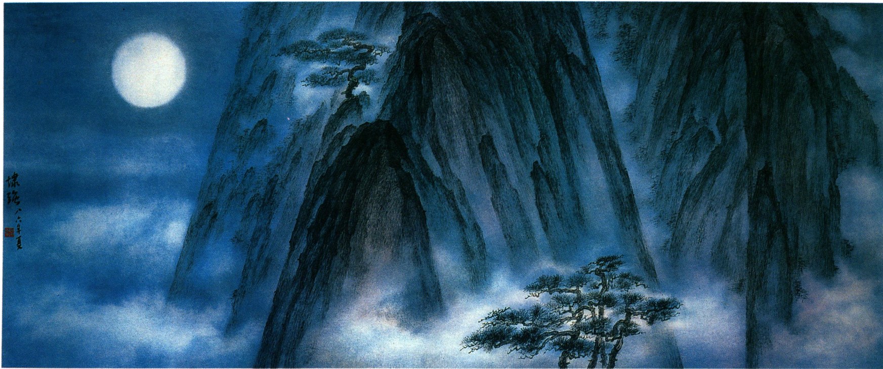
靳埭強 松山雲月 一九八六 Kan Tai-Keung Mountain pines and moonlight 1986