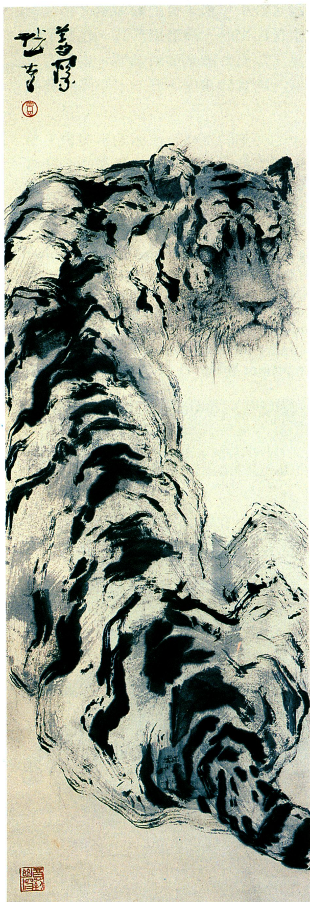
楊善深 虎視 一九七三 Yang Shen-sum Tiger 1973