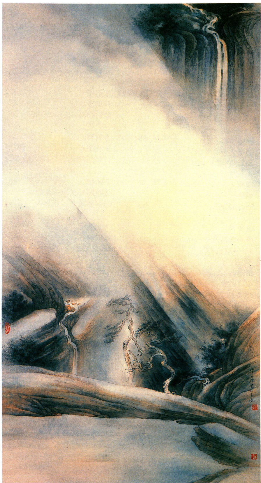
徐子雄 自在的一角 一九八四 Chui Tze-hung Serenity 1984