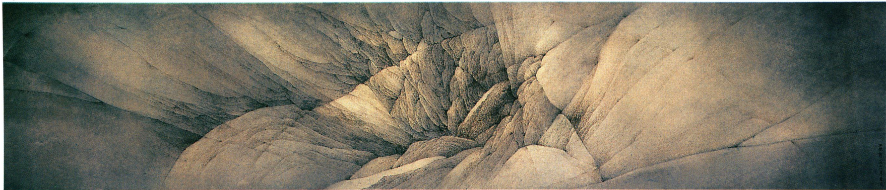
王無邪 清幽 一九七八 Wong, Wucius Reclusion 1978