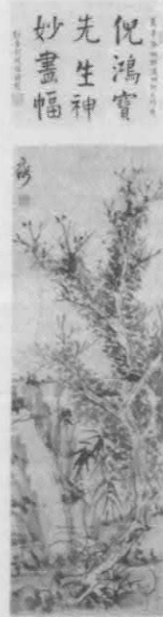
46 《枯木竹石圖》 倪元璐 (1593 - 1644)

張氏作品有嚴謹及粗放兩種風格，此圖即屬後者。畫一人獨自泛舟，翹首仰望兩岸秋日景色；艇上置有一酒罈，似是表達借酒擷取創作靈感的景象；對岸水閣內有僕童伺候書齋。作品頗具生活寫真及敘事意味。樹石點染隨意，筆致細碎而不亂。皴法勾斫有力，其棱折斧鑿之痕可見陸治影響（參較藏品目錄《立軸》，編號25）。用墨則蒼潤而多變化，再以淡赭墨烘染，表現一派空濛淡遠的醉人秋意。論者謂其畫「天然入格」，細味此作，實見張氏能將深入觀察大自然的體驗及個人情懷融合於創作裏。