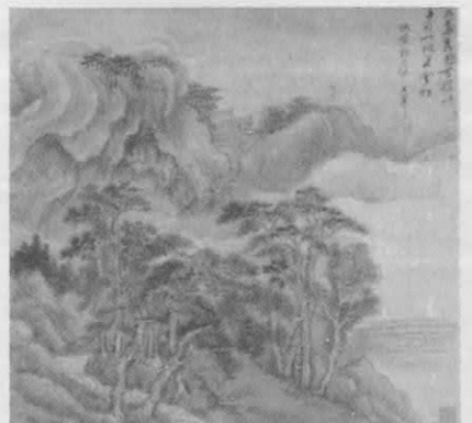
97 《仿王蒙山水圖》 王翬 (1632 - 1717)

此圖是查氏晚年之作，意境荒寒，曠逸高遠，與「新安四家」之毓秀疏清近似（參較藏品目錄《立軸》，編號69；弘仁《山水圖》）。山巒頂峰連綿有致，屬其風格之一。墨色濡潤，點染隨意，乃出自吳鎮；而樹法及孤舟釣徒造型亦明顯為吳氏家法。