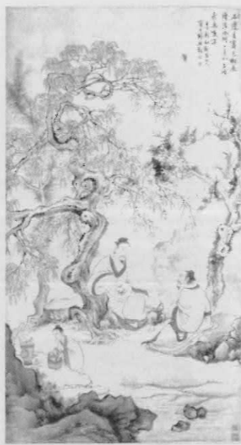
121 《高士吟興圖》 華岳 (1682 - 1756)

此乃高氏之指頭畫作，其運指如筆，皴擦、線條均揮灑自如。圖中古松虬曲，松皮皴如龍鱗，松葉挺拔遒勁。高士俯身觀泉，線條利落明快。畫激流波紋則用指矯捷靈活，見圖仿如聽見淙淙水聲。故張庚《國朝畫徵錄》謂其指墨有如王初平「叱石成羊」之妙，寓其畫功非凡，筆下之物均栩栩如生，躍現紙上。