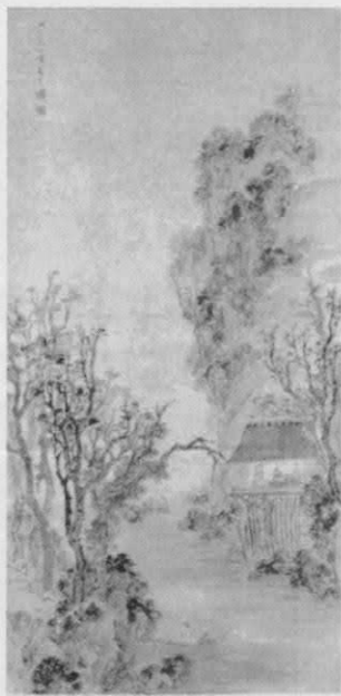
43 《溪山秋色圖》 張宏 (1577 - 約 1652)

張宏，字君度，號鶴澗，吳郡（今江蘇蘇州）人。工山水，蒼勁雅秀，筆墨蒼古，丘壑靈異，得元人法。亦師沈周，又嘗臨摹陸治作品，境界深遠，筆墨蒼古。畫石連皴帶染，人物畫有寫世俗生活景像者，頗能揉合文人畫與風俗畫而拓開新域。