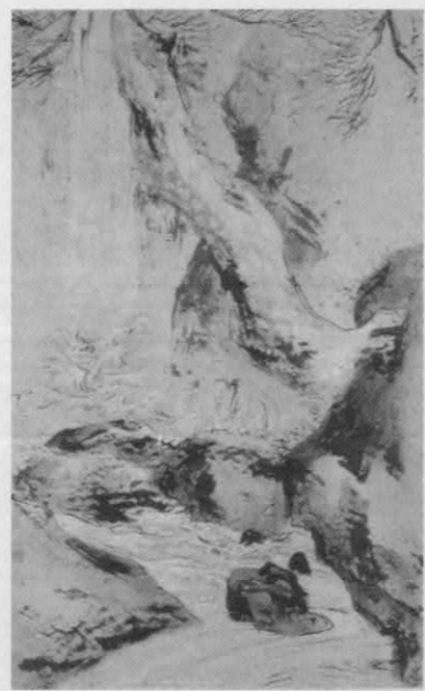
116 《觀泉圖》 高其佩 (1660 - 1734)

軸》，編號25），此畫氣氛雖具王蒙的蒼鬱，但表現的卻是一派閒適靜態，沒有王蒙的率性自然。以淡石綠、赭墨烘染更是王翬自家本色。而此作所用絹本，繪畫效果亦明顯與王蒙常用的紙本不同。故物料的選擇又是畫家取決表現效果的重要因素。