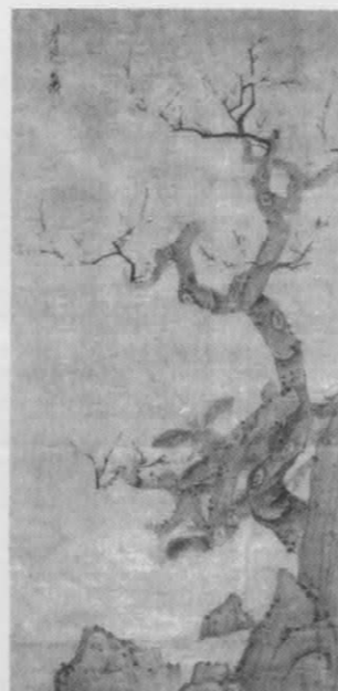
53 《山茶梅石圖》 陳洪綬 (1598 - 1652)

此畫寫蘭、竹、樹、石，乃倪氏平素喜畫的題材，亦為文人畫中常見。畫中可窺其對用筆及墨色濃淡變化的運用。用筆挺拔蒼莽，乃草書筆法入畫。以濕筆作葉，乾筆畫枝枒，以表現出竹木的蒼茂及「水墨墨章」的效果。黃賓虹評其畫「脫盡邪甜俗賴，純任自然」，正合此幅。