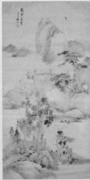
241 《仿朱耷山水圖》 啓功 (1912 生)

此畫構圖及景物造型均取法唐寅之山水（參較藏品目錄《立軸》，編號16）。用「斧劈皴」寫山石崖壁，益增陡峭挺拔之勢。溪瀑則用「以石畫水」法，表現流水迂迴急湍之貌。行筆方硬，轉折處主角畢露，均出自馬遠、夏圭家法。陳氏以其熟練的「院體」技法，輔以明快用色特點，足令其畫藝於風格紛陳的近代畫壇佔一席位。