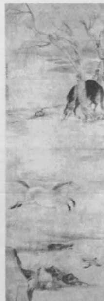
65 《雙馬圖》 張穆 (1607 - 1683)

陳氏之畫甚有先秦韻味，造型樸拙，設色古雅。而線條運用方面，則有其一貫之風格：沉著蒼勁，方潤圓轉，式得其法，甚富變化。以淡墨勾花，點苔散聚有致，古梅枝枒曲折，形態奇詭，稍有其時代之變形風格，但又不失美態。此圖圓細雅致，應屬晚期作品。陳洪綬嘗作版畫插圖，其畫作亦多富平面裝飾趣味。