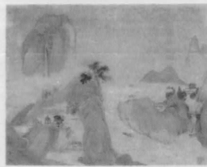
128 《青綠山水圖》 蔡嘉 (1686 - 1756 後)

清乾隆時期，揚州地區商業發達，不少巨賈富商附庸風雅，相競搜羅內容高雅或新奇之繪畫作品。華岳此作，題材繪高士槐蔭下品茶消夏，極具閒情逸致，正是切合時人品味之題材。此幅作品反映出華岳人物畫成熟的風格。人物身體偉岸，神態自若。高士交談之神情動態都能被華岳秉承「傳神」及「寫心」的傳統——刻劃。畫人物的技法受陳洪綬的影響（參較藏品目錄《立軸》，編號52及54），線條流暢，造型精確。此外，華岳亦擅長創造背景及構圖以襯托人物及氣氛。前景坡石疏秀，以南宋馬和之「蘭葉描」寫成，樹木鬱蔥，配以「夾葉」及「點葉」，乾濕墨並用，恣意雄渾，營造出一個幽靜蒼翠的環境。