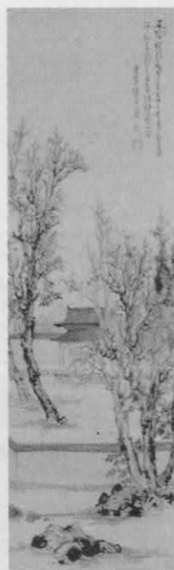
229 《秋暮禪鐘圖》 溥儒 (1896 - 1963)

溥儒，原姓愛新覺羅，字心畬，號西山逸士，義皇上人。滿族，河北宛平人，為清宣宗曾孫。自幼飽學，專注於研究藝事、詩詞、書畫。辛亥革命後，居北平西北戒壇寺，前後十年。一九一五年畢業於北平法政大學，後遊學德國，獲兩博士學位返國。後居頤和園，專事繪畫，窮研家藏之書畫名蹟。曾赴日本任京都帝國大學教授，亦有出任北平國立藝術專科學校教授，並曾於香港講學。後到台灣，長期在台灣師範大學任教授，一直致力於繪事和教育。山水、人物、花卉皆擅長。山水取法於宋、元，又以南宋為宗，極有文人意趣。喜用熟紙，作畫較少烘染，著重線條勾摹，有雅秀俊逸之韻致。與張大千有「南張北溥」之稱，另二人與黃君璧有「台灣三傑」之稱。著有《四書經義集證》、《寒玉堂論畫》等。